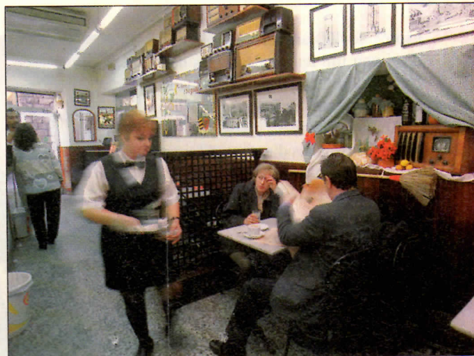
Un local popular que fa molt servei sense pretensions

ELISABETS, 2 | 4. BARCELONA ☎ 93 317 58 26